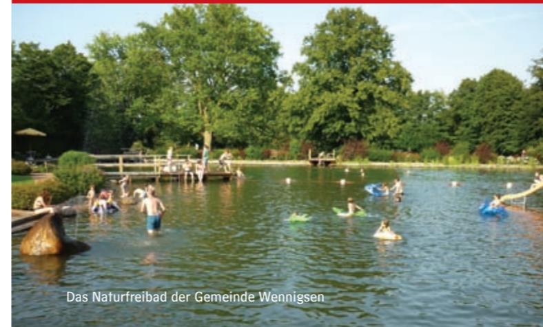
Das Naturfreibad der Gemeinde Wennigsen